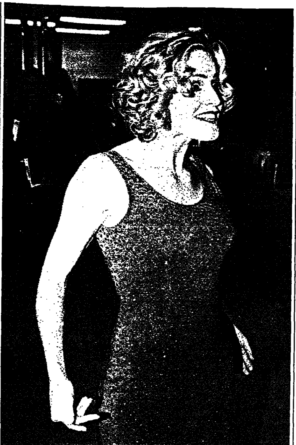
الشجرة الزيبات شيو بطلة الغنم الجديد «القدس» حضرت حفل العرض الأول للغلم في واشنطن ليلة أمس الأول

دبي - ا ف ب: اصدرت امانة الامارات السبع في رأس الخيمة (أحد الامارات السبع) في دولة الامارات العربية المتحدة) احكاما جديدة بحق مخالفات اشارات وشارات وشارات السير تشمل الحسب والغرامة و50 جلدة.